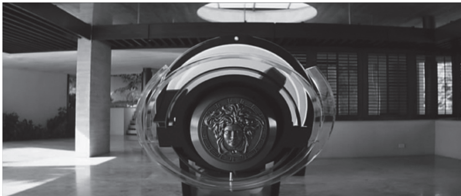
Figura 3. Altorrelieve en una de las cámaras de curación (Block, Blomkamp & Kinberg, 2013, 04:09)

La figura del rostro grabado en la placa de la cámara de curación no es del todo dicente si se busca identificar qué o a quién representa; sin embargo, el lugar que ocupa es intencional. La puesta en discurso le posiciona en el centro del campo, destacando además el objeto que le sirve de soporte. La figura se encuentra doblemente resaltada y entender su sentido demanda no solo tomar en cuenta la focalización de la que ha sido objeto, sino también los rasgos semánticos en ella vertidos ( semas aferentes ) 23 debido a su ubicación. Más arriba, se habló del fin cumplido por estos aparatos: la curación y la conservación de la juventud. En sí mismos, estos representan lo más cercano a la realización simbólica de las aspiraciones humanas de inmortalidad. Por tanto, la figura grabada en la placa adquirirá dichos semas y el rol temático de dicha realización . Ahora bien, dado que estos artilugios tecnológicos son producto del avance de la civilización elysiumiana cabría agregar además el rasgo semántico de /exclusión/, pues si el acceso a Elysium es reservado, lo mismo sería para las cámaras de curación. Recuérdese que la madre terrícola desea curar a su hija. Esto genera además una oposición entre medicina terrestre y medicina elysiumiana, en la cual la primera es demeritada, definiéndole como inútil. Esta incompetencia se figurativiza en la misma madre, ya que ella es médica y trabaja en uno de los hospitales terrestres.