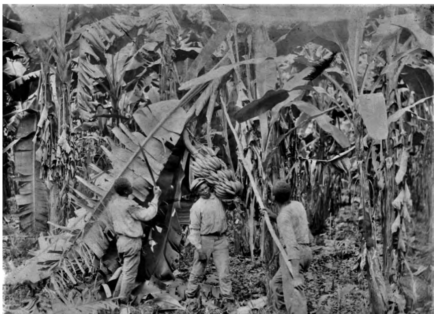
Figura 1. Trabajadores afrocaribeños en finca bananera del Caribe costarricense