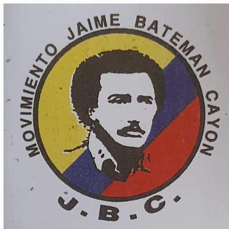
Figura 1. Escudo del MJBC

norte y oriente del departamento del Cauca, en Corinto, Miranda y Popayán. En el departamento del Valle contó con algunos pequeños núcleos urbanos e ideológicos en Florida, Palmira y Cali”. 26