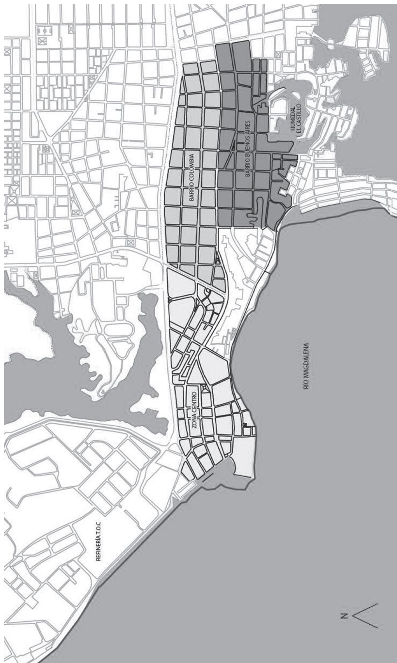
Plano del crecimiento urbano de Barrancabermeja entre 1926 - 1936