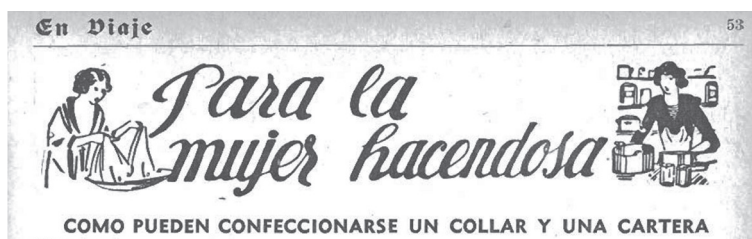
Figura 2. Ejemplos de imágenes de secciones en las guías turísticas, modelizadores de la imagen femenina.