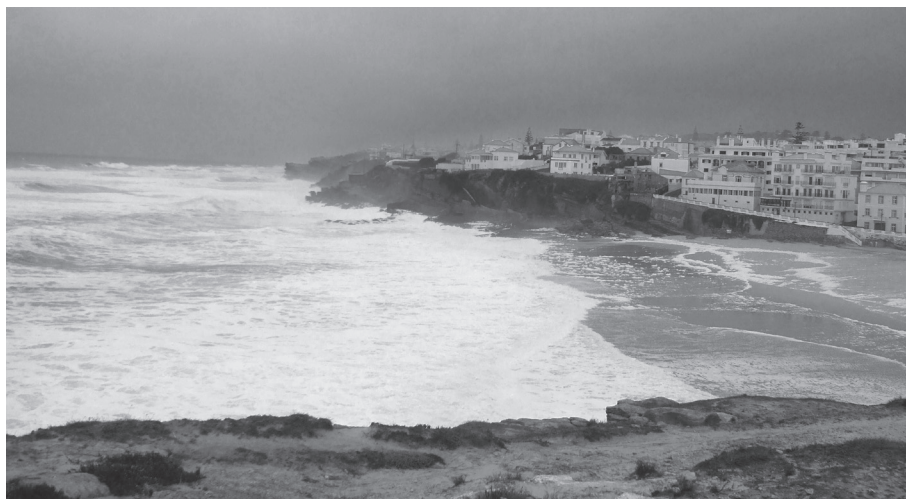
Figura 4. Vista do Alto da Vigia para a praia das Maças (Dezembro de 2011).