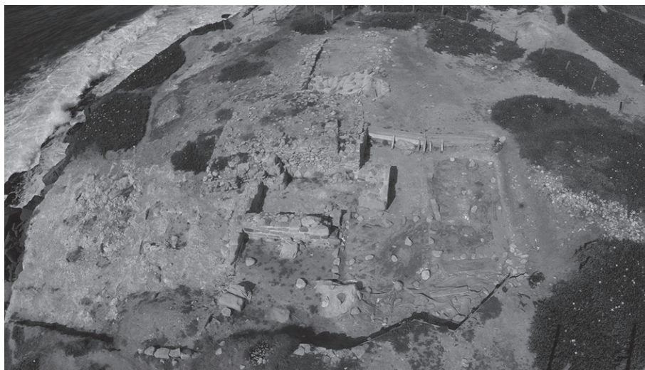
Figura 5. Alto da Vigia. Perspectiva aérea do local onde se realizam os trabalhos arqueológicos (Abril de 2015).