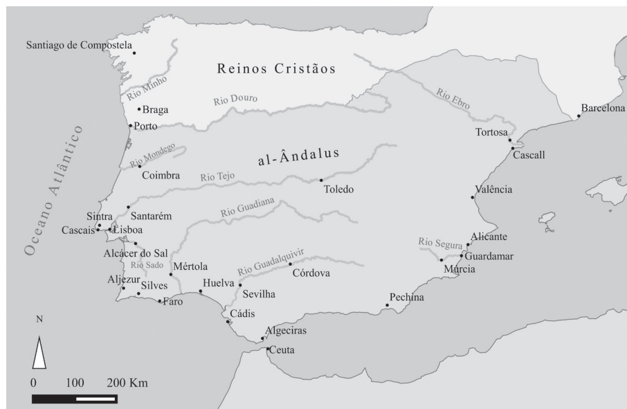
Figura 1. Mapa simplificado do al-Ândalus e parte do Norte de África, c. 868.