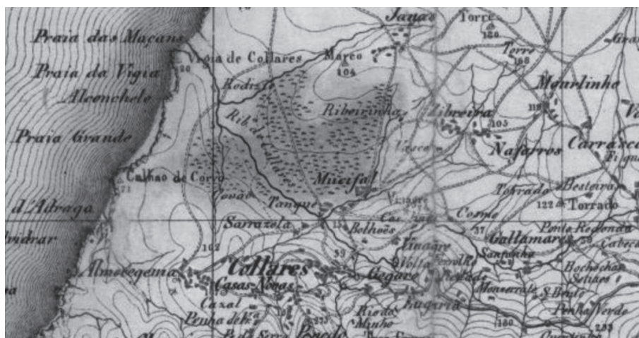
Figura 2. Povoamento nas proximidades do rio de Colares segundo a Carta chorographica dos terrenos em volta de Lisboa compreendendo a principal parte do Tejo adjacente à sua foz , escala 1/100.000.