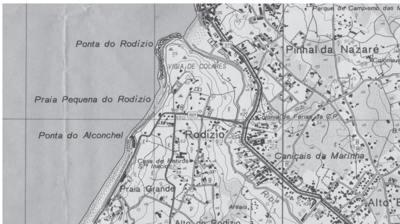
Figura 3. Pormenor da área de Colares. Carta Militar de Portugal, Colares (Sintra) , escala 1/25.000, folha 415.

Fuente: Serviço Cartográfico do Exército, 1991.