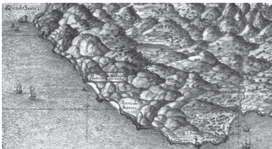
Figura 9. Pormenor da costa de Sintra e Cascais numa carta do atlas da Península Ibérica de Pedro Teixeira, 1634. Destaque para o porto do Guincho, mais conhecido por porto do Touro 103 .