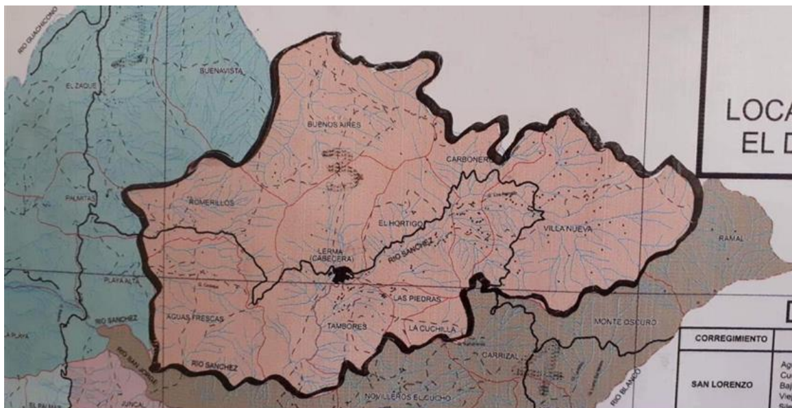
Foto No. 1. Mapa del corregimiento de Lerma.