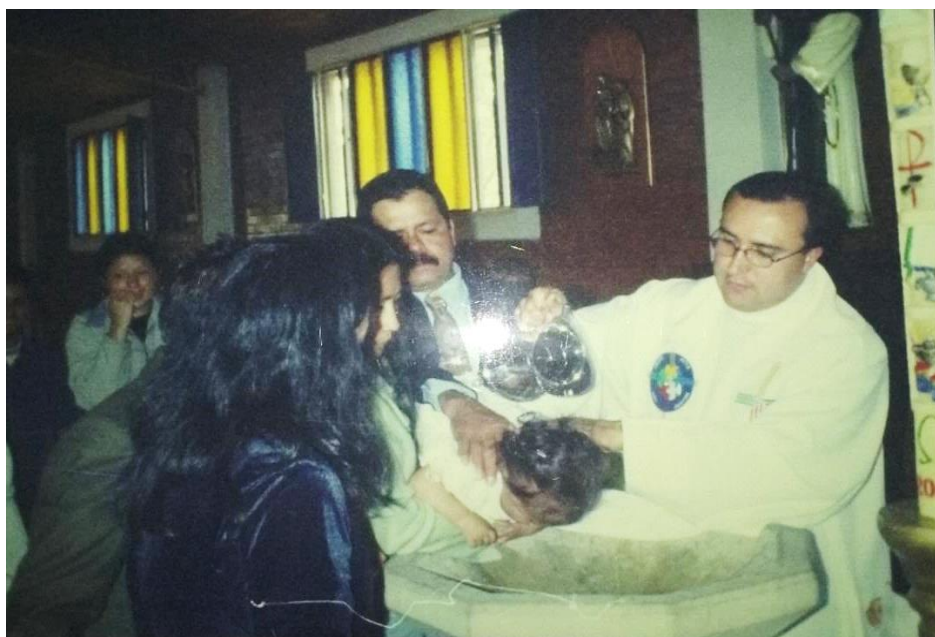
Imagen No. 3: Bautismo al primer año de mi nacimiento (2004).