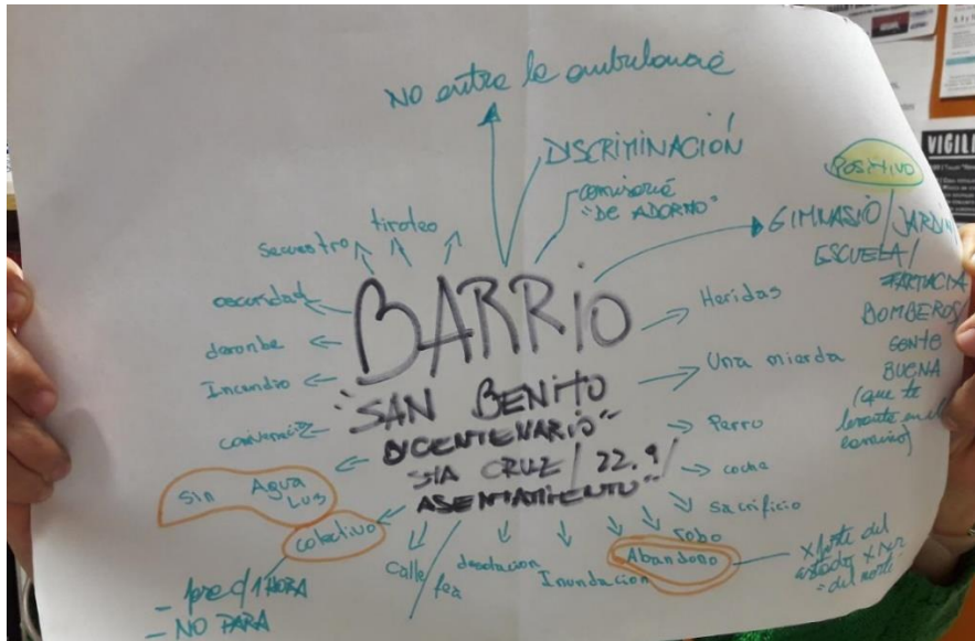
Imagen 6. Taller Teatro Comunitario. Comedor “Red de Mujeres Solidarias”