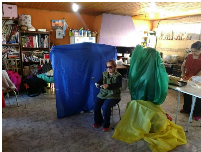
Imagen 9. Taller Teatro Comunitario. Comedor “Red de Mujeres Solidarias”