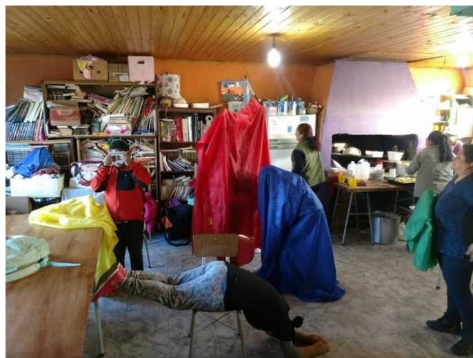
Imagen 10. Taller Teatro Comunitario. Comedor “Red de Mujeres Solidarias”

Fuente: Archivo fotográfico del Equipo de Educación Popular UNPA UARG, Río Gallegos, Santa Cruz, Argentina, 2018 13