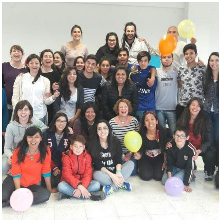
Imagen 1. Taller Teatro Comunitario