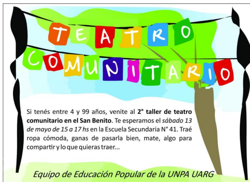
Imagen 2. Flyer de difusión del taller de teatro comunitario