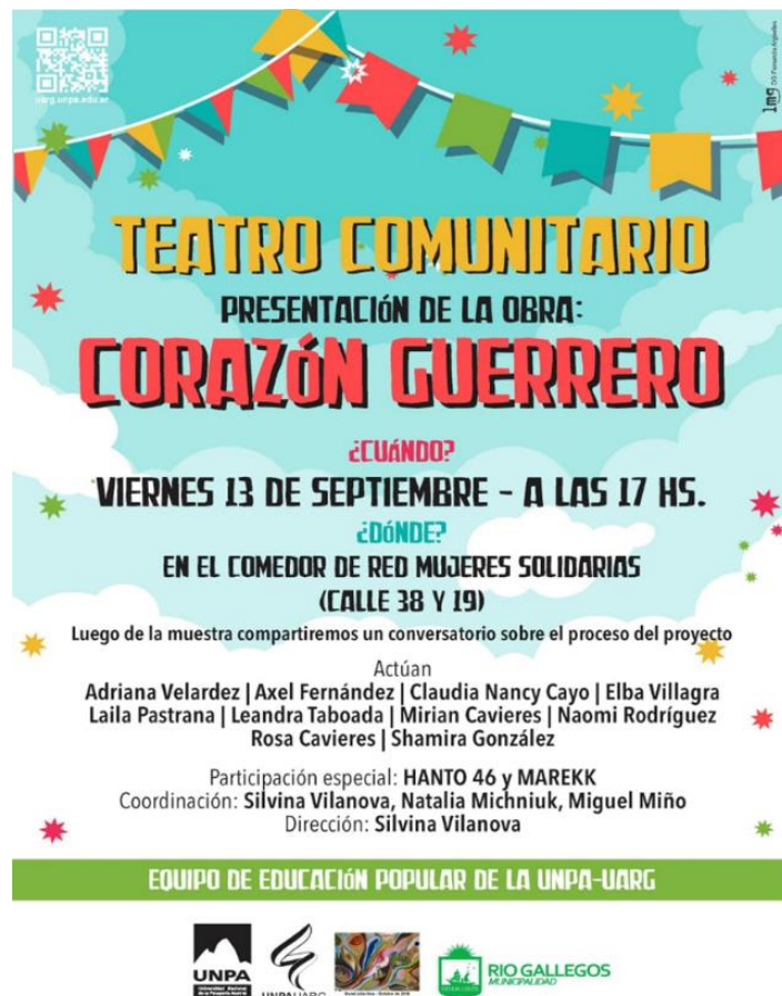
Imagen 11. Flyer de difusión de la Muestra