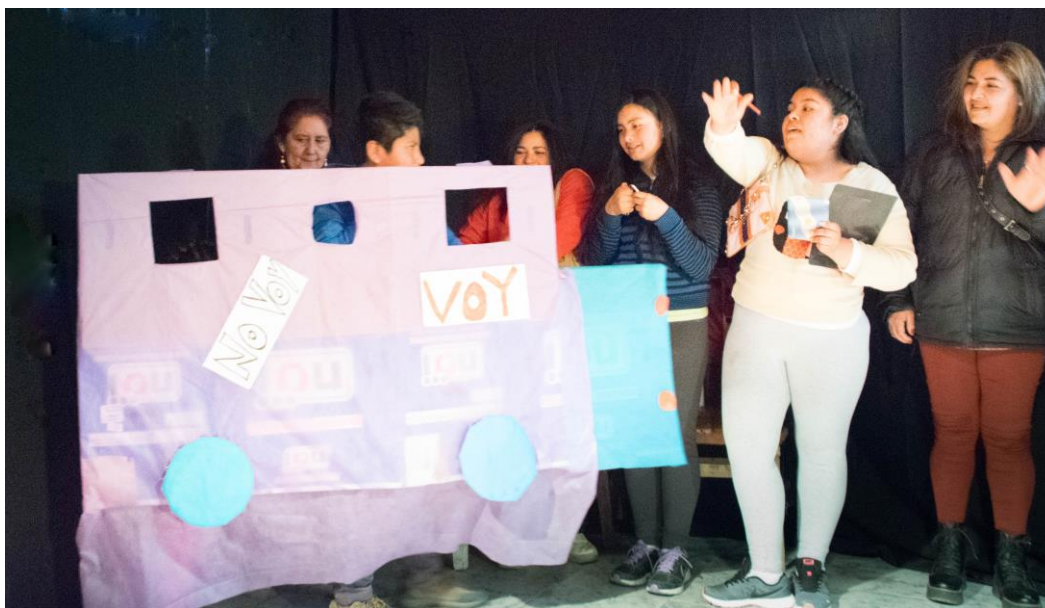
Imagen 13. Fotografía de Mercedes Mosso

Fuente: Río Gallegos, 13 de septiembre 2019. Muestra del taller de teatro comunitario del Barrio San Benito en el Comedor Red de Mujeres Solidarias. Archivo fotográfico del Equipo de Educación Popular de la UNPA UARG