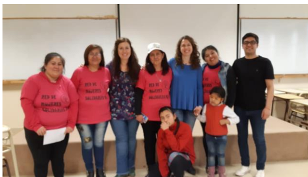
Imagen 4. Jornadas “Construcción de ciudadanía en contextos de crisis. Aportes desde la educación” organizadas por el IEC (Instituto de Educación y Ciudadanía) de la UNPA