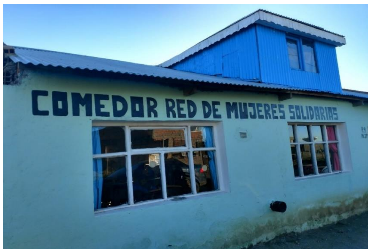
Imagen 3. Comedor “Red de Mujeres Solidarias”