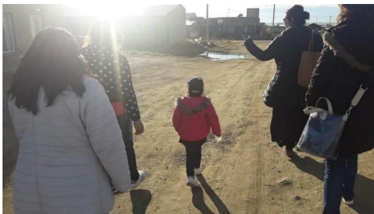
Imagen 8. Taller Teatro Comunitario. Barrio San Benito