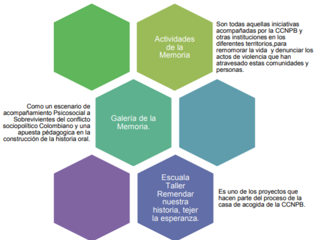
Imagen No. 2. Procesos de intervención