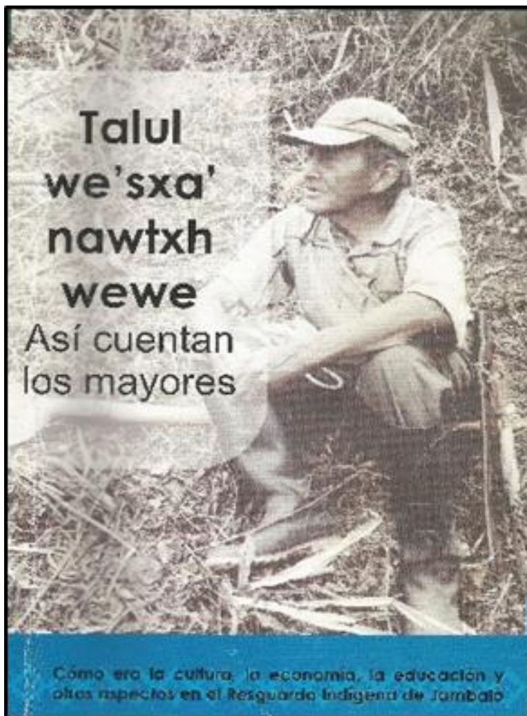
Imagen 2. Portada de la cartilla “Así cuentan los mayores”