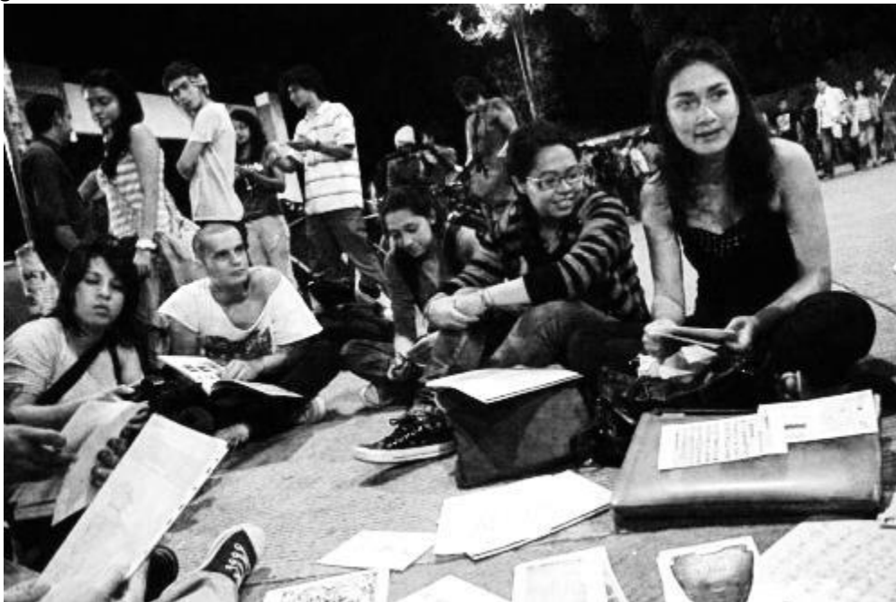
Taller de poesía experimental con un grupo de estudiantes, UIS.