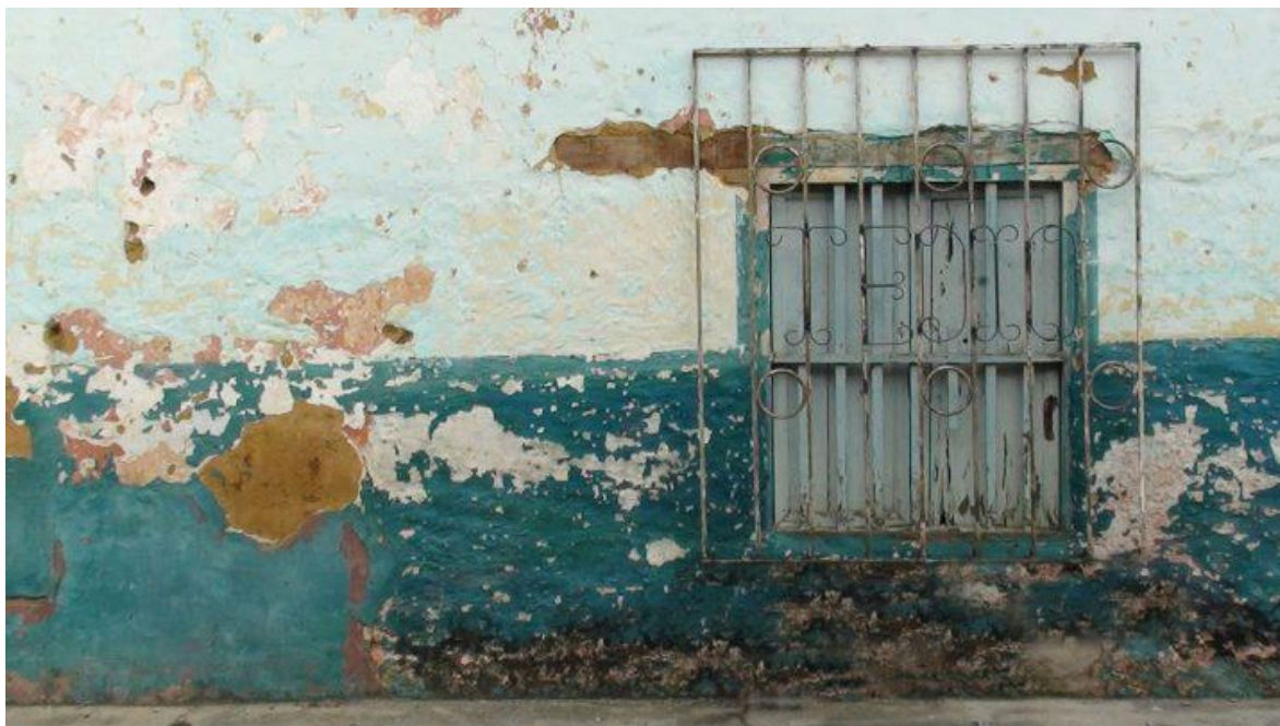
Reja, antes de ser instalada en la UIS,

"Reja". Ornamentación sobre hierro recuperado. 1.25 x 1.30 mt. Ganadora en la modalidad de Escultura, Salón MIRE de arte metropolitano, 2011.