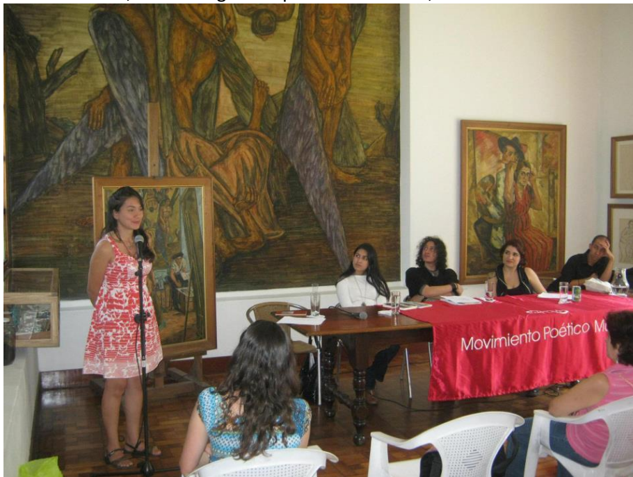
Lectura de poemas del XXI Festival Internacional de Poesía de Medellín en la casa de Pedro Nel Gómez.