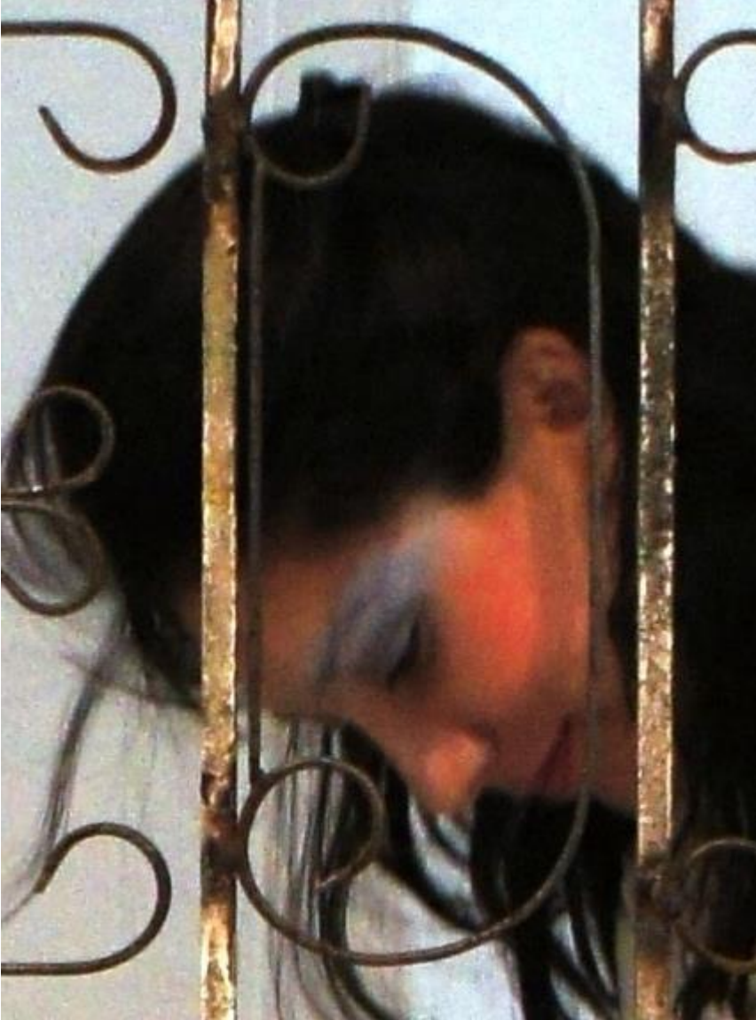
Reja. Ornamentación sobre hierro recuperado. Performance: Sublimación (2011)

* Poemas concretos . Galería de la Escuela de Arquitectura, Universidad Nacional de Colombia, sede Medellín. Diciembre de 2004.