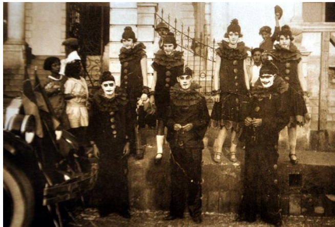
Figura 9. Carnaval Club del Comercio.