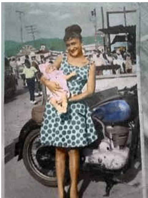
Figura 5. Feria de Bucaramanga, 1964.