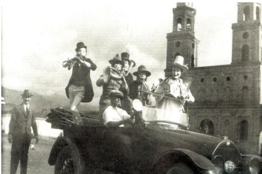
Figura 6. Comparsas Club del Comercio.