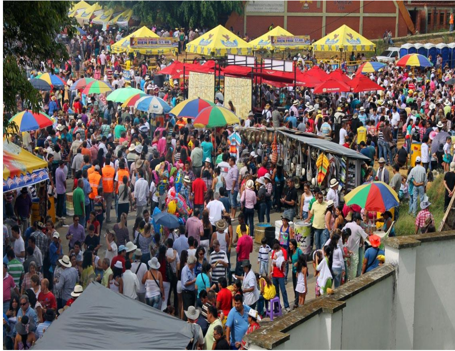
Figura 7. Festival de Colonias.