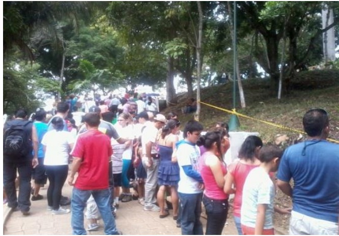
Figura 4. Viacrucis a Morrórico-Viernes Santo.