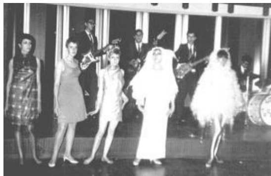
Figura 11. Carnaval Club Campestre.