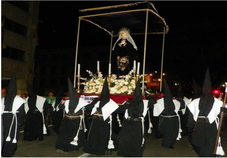
Figura 3. Paso del Nazareno.