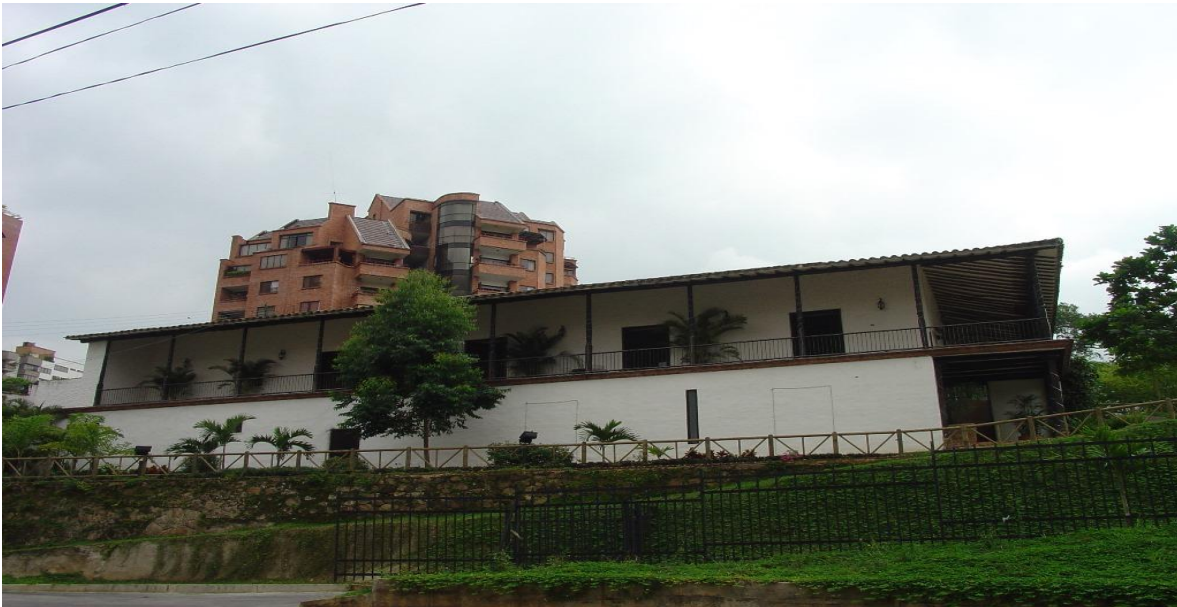
Figura 2. Vista actual de la Casa del Diablo.