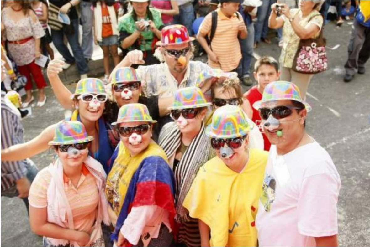
Figura 8. Carnaval del Oriente.