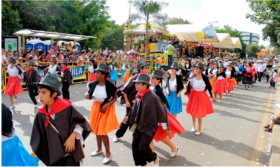
Figura 12. Carnaval del Oriente.