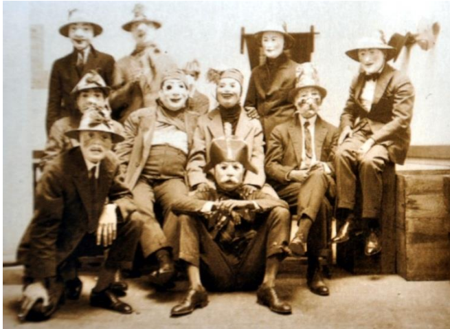
Figura 10. Carnaval del Club del Comercio.