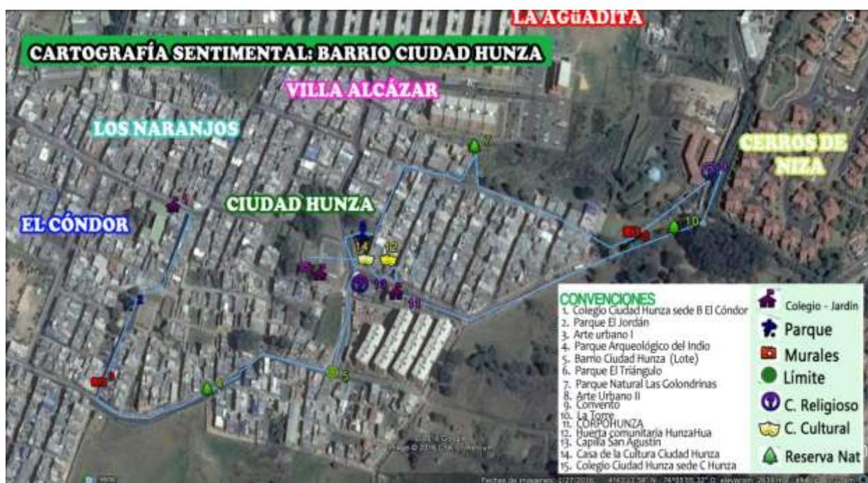
Imagen No. 2: Cartografía sentimental: barrio Ciudad Hunza