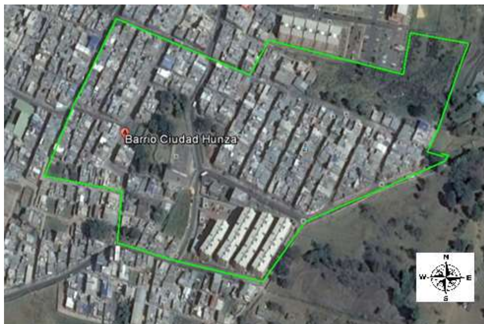
Imagen No. 1. Mapa del barrio Ciudad Hunza

Fuente: Delimitación socioespacial barrio Ciudad Hunza, (Google Earth, 2017).