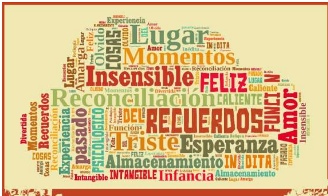
Imagen No. 3. Nube de palabras ¿Qué es una memoria?

En concordancia con lo anterior, lo que se buscó en este ejercicio fue establecer un dialogo entre lo aprendido y lo vivido. De igual manera, se buscó establecer una relación – acción entre estudiantes y docentes, mediada por las preguntas y la crítica sobre la historia del barrio y el papel protagónico que pudiesen llegar a asumir los estudiantes al interior del mismo, esto a través de acciones concretas dirigidas a establecer una relación directa entre escuela y territorio. En donde los estudiantes nuevamente son quienes se reconocen como sujetos situados en un espacio – tiempo determinado.