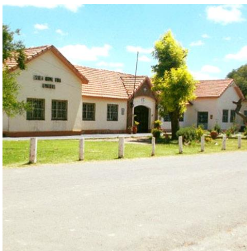
Fotografía 2. Escuela Almafuerte en el presente

Actualmente, recibe alumnos provenientes de distintas partes de la provincia, e incluso de provincias vecinas. Cuenta con un área de residencia para alumnos, proveeduría, biblioteca, huerta, vivero, porqueriza, granja, sectores de producción de lácteos y panificación, etc.