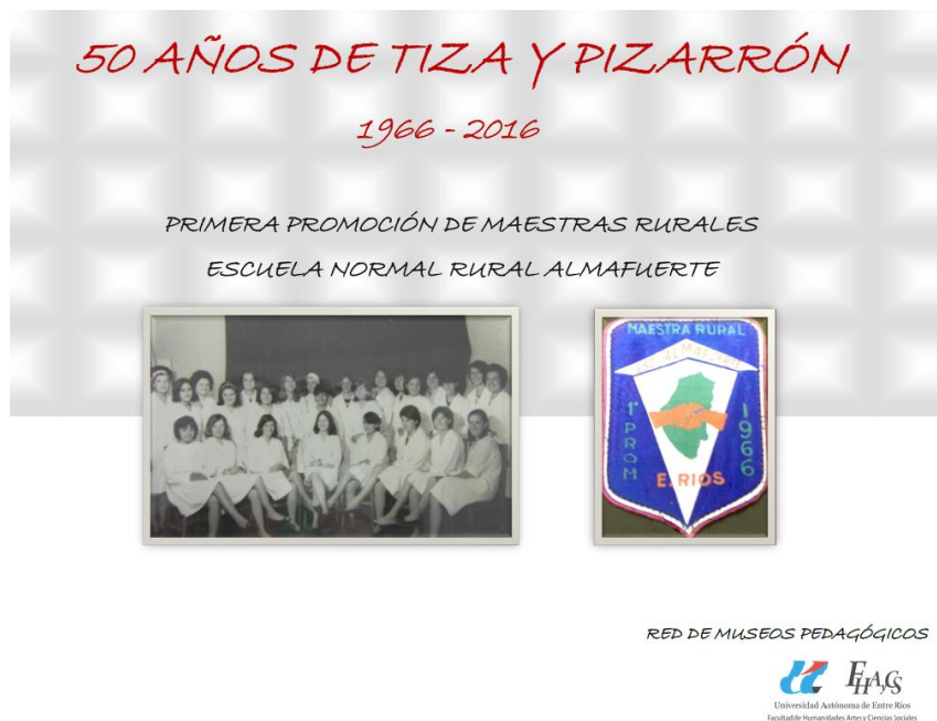
Fotografía 4. Poster de la muestra 2016.