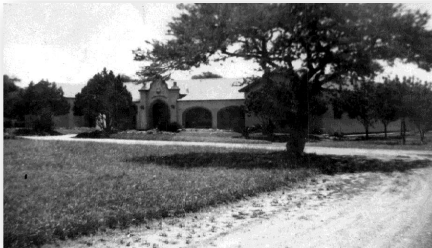
Fotografía 1. Escuela Almafuerde a principios de la década de 1960.

Keywords: identity, museum, heritage, extension.