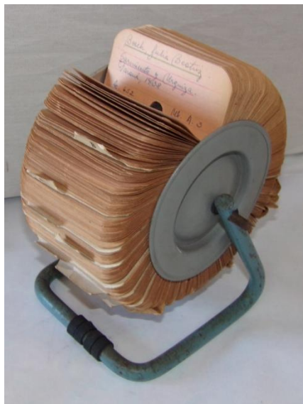
Fotografía 3. Fichero utilizado en la biblioteca de la institución, probablemente hasta la década de 1980.

El inventario y la confección de las fichas museográficas es el último paso, que aún no ha comenzado.