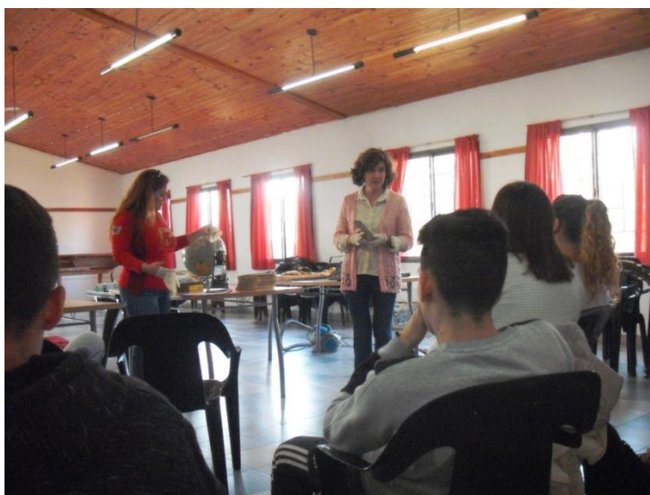
Fotografía 6. Taller Museología en Almagro, 2017.

Con respecto al pueblo de La Picada, está proyectado trazar líneas para una mayor conexión con los habitantes y las instituciones del pueblo. Es una pequeña comunidad, en cuyo territorio se emplazan las 600 hectáreas del parque. La conexión con el parque les ha dado una impronta ecológica, de cuidado del medio ambiente y defensa de la flora y fauna nativos. Cuentan con escuela, y un centro tradicionalista ubicado en la estación de tren en desuso, en plena recuperación. La vía ferroviaria era de suma importancia, como para todos los pueblos rurales del interior del país, pero esa línea hace años está clausurada. Uno de los apeaderos de la línea férrea que llegaba al pueblo, está ubicado en los terrenos de la escuela, y era el medio principal de transporte utilizado por las alumnas. Lamentablemente, el apeadero (una pequeña construcción de chapa y madera) fue demolido hace unos pocos años, quedando sólo el cartel para marcar su recuerdo.