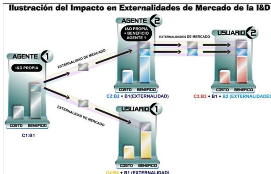
Figura 4: Externalidades de Mercado.

La presente investigación abordó el problema de generación de métricas homologables a nivel nacional e internacional sobre los inputs, outputs, outcomes e impactos de la I&D de la Universidad del Cauca en términos de la creación y