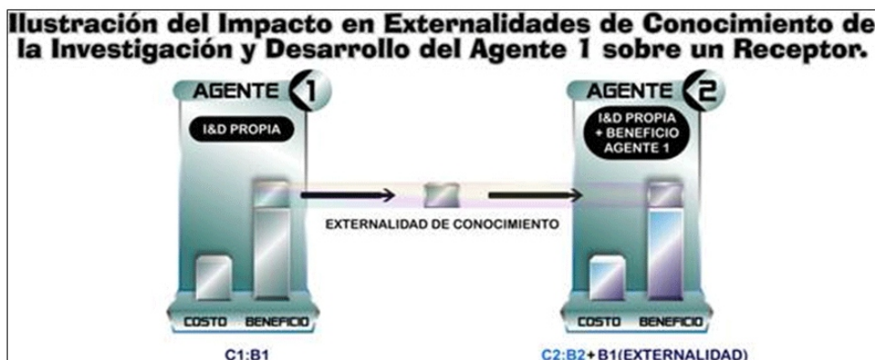
Figura 3: Externalidades del conocimiento.

Externalidades de Conocimiento: El conocimiento creado por un agente o grupo de investigación puede ser usado por otro sin compensación alguna, o con una compensación de menor valor a la real. El beneficiario del spillover o externalidad puede usar el nuevo conocimiento para copiar o imitar los productos o procesos del innovador, (por ejemplo haciendo réplicas de investigación) o puede usarlo como input para un proceso de investigación conducente a otras nuevas tecnologías. La Figura No 3 ilustra el impacto de la I&D del agente 1 sobre un receptor o Agente 2: Dentro de los beneficios de conocimiento de la I&D del agente 1, existe una proporción que no es "apropiada" o retenida por el agente 1, y que como consecuencia se traslada a otro agente, afectando positivamente su relación costo beneficio.