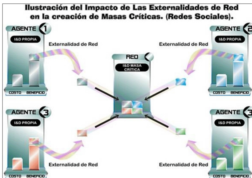
Figura 5: Externalidades de Red.

[4]Adam B. Jafee, Economic ANALYSIS OF RESEARCH SPILLOVERS: IMPLICATIONS FOR THE ATP, NIST GCR 97-708