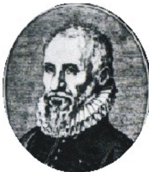
Figura 1. Ambroise Paré.

En 1521, se practicó autopsia médico-legal al cadáver del pontífice León X, para establecer la causa de su muerte, en atención a la sospecha de haber sido envenenado.