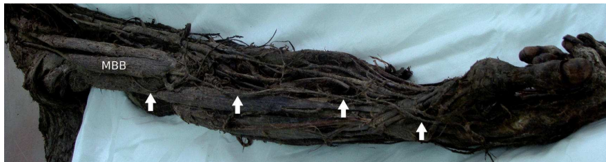
Figura 2. Las flechas blancas señalan el nervio cutáneo antebraco lateral a su emergencia por detrás del músculo bíceps braquial (MBB) y su recorrido a lo largo del borde lateral del antebrazo hasta llegar a la mano.