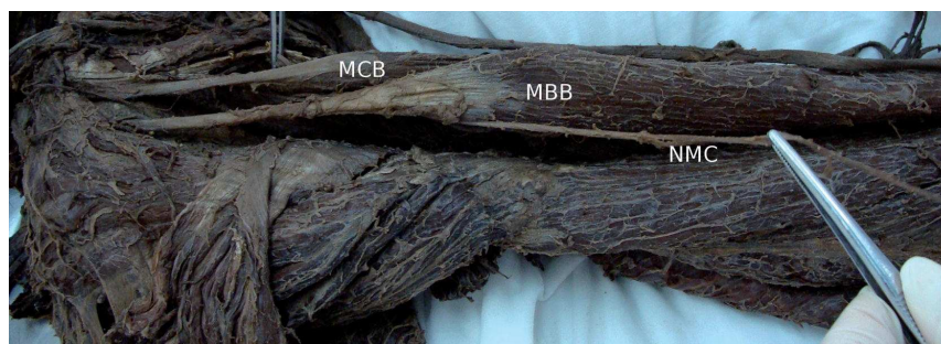
Figura 1. Aparece el nervio musculocutáneo (NMC) en el brazo atravesando al músculo coracobraquial (MCB) para situarse luego por detrás del músculo bíceps braquial (MBB) y emerger por su borde lateral.

A un cadáver de sexo masculino, mestizo, de nacionalidad colombiana, de 50 años de edad, perfundido con solución acuosa de formaldehído al 10% y conservado durante tres meses en una solución similar, un grupo de estudiantes de medicina le realizó una disección instrumental roma en el anfiteatro del Departamento de Morfología de la Universidad del Valle en Cali, Colombia. En el miembro superior derecho de este cadáver se encontró una variación anatómica rara del nervio CABL. El recorrido del nervio musculocutáneo en el brazo (Ver Figura 1) y del nervio CABL en el antebrazo (Ver Figura 2) era similar al tradicionalmente descrito, pero en lugar de terminar este último a nivel del carpo, se prolongó hasta el dorso de la mano asumiendo todo el territorio sensorial del ramo superficial del nervio radial (Ver Figura 3). Es decir, que el nervio CABL, continuación del nervio musculocutáneo a partir del codo, llegaba hasta el dorso de la mano y se dividía en nervios digitales dorsales para los dedos pulgar, índice, medio y mitad lateral del anular. En este caso el NRS estaba ausente. Se incluye un esquema que resume todo el trayecto del nervio CABL, de acuerdo a la variación anatómica encontrada en este cadáver (Ver Figura 4).