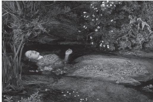
Título: Ofelia Autor: John Everett Millais Dimensiones: 76 cm x 1,12 m Técnica: Óleo sobre lienzo

Representa a Ofelia, un personaje de la obra de Shakespeare "Hamlet", cantando antes de que ella se ahogara en un río en Dinamarca. La pintura es conocida por su representación de la flora, haciendo hincapié en los patrones de crecimiento y decaimiento en un ecosistema natural.