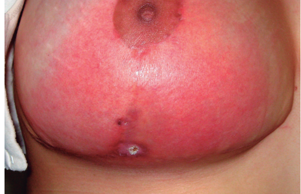
Figura 6. Celulitis en post quirúrgico de cirugía mamaria

sea de índole reconstructiva o estética, el cual no está exento de complicaciones que pueden llevar al deterioro de la calidad de vida del paciente y solamente el conocimiento de estas complicaciones permitirá su prevención, diagnóstico y manejo temprano.