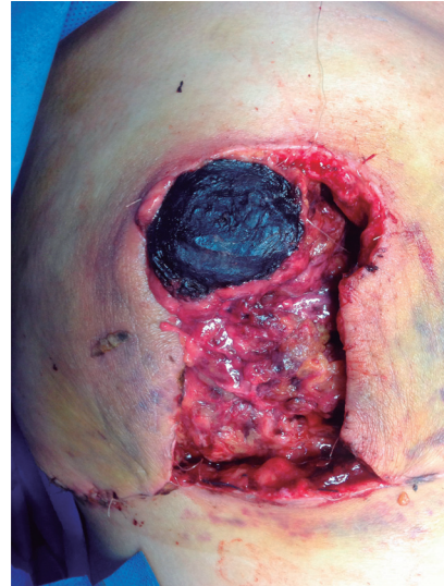
Figura 4. Dehiscencia de la herida quirúrgica en mamoplastia de reducción

aproximación sobre la cicatriz resultante posterior a la cirugía si la paciente tiene cicatrices previas. Generalmente estas complicaciones tienen un terrible resultado estético y son difíciles de manejar (Ver Figura 5).