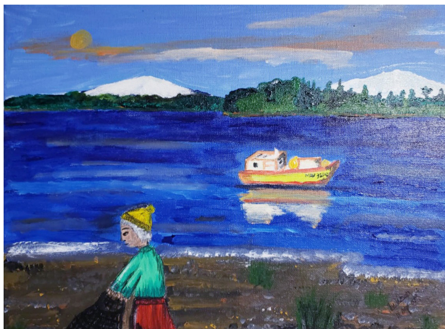
Ilustración 2. Ejemplo de trabajo artístico.

texto explicativo a fin de comprender el contexto en el cual fueron elaborados ( Ilustración 2 ).