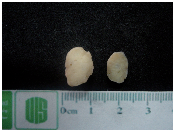
Figura 1A y 1B Lesión escindida, visión macroscópica. A) Se observan los hallazgos macroscópicos de una lesión blanquesina, homogénea, lobulada y encapsulada que al corte (B) presentaba consistencia cauchosa

Los hallazgos histopatológicos mostraron piel con la presencia de una lesión tumoral benigna bien delimitada ubicada en la dermis, de configuración mixta, secundaria a la existencia de elementos derivados de dos líneas celulares: un componente epitelial, el cual se conforma de células cúbicas a bajas que presentan un escaso citoplasma y núcleos normocrómicos que se disponen en nidos y estructuras tubulares de diferentes tamaños, éstas se sostienen por una capa de células, algunas de ellas con citoplasma claro, otras presentan diferenciación escamosa con formación de láminas de queratina, además de encontrarse hileras y trabéculas de células acidofílicas a claras que recuerdan elementos mioepiteliales. Figura 2. Todos estos componentes se hallan inmersos entre un estroma fibromixoide con zonas de formación de islotes de cartílago hialino maduro, mejor evidenciado con tinciones de histoquímica. Figura 3. Los focos de congestión vascular son escasos. La lesión se rodea externamente por una delicada cápsula de tejido fibroconectivo.