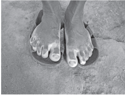
Título: Pescador, contaminación y dermatosis