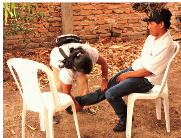
Figura 2. Inicio del Cateo

La sobandería para los Nasa es un saber práctico. La mayor parte de los sobanderos/as afirma que han nacido con este “don”, el cual se manifiesta ante eventos críticos en el propio cuerpo, en el de un familiar cercano o en las pequeñas especies de animales a su cargo. Un grupo menor refieren ser aprendices de un/a sobandero/a reconocido, siendo la repetición la base del perfeccionamiento de sus técnicas, e incluso en unos pocos casos, el acompañamiento a quiroprácticos y fisioterapeutas localizados en las áreas urbanas de los municipios.