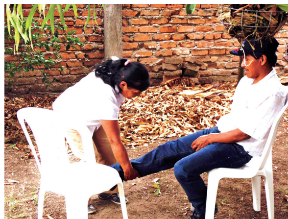
Figura 1. Acercamiento

La acción registrada tuvo una duración aproximada de quince minutos, y durante la misma el autor pudo preguntar tanto a la “sobandera” como al consultante, así como a otro público testigo sobre la intervención. Algunas de las respuestas brindadas acompañan las imágenes.