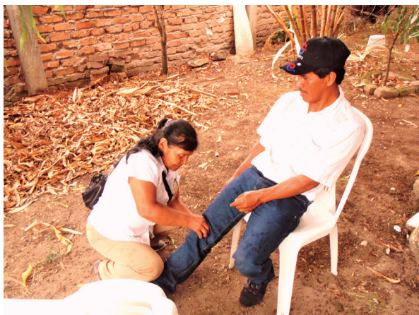
Figura 8. Cerrando

Es esta extracción del “frío” la que concentra la mayor parte del trabajo del sobandero/a. En esta interacción varias cosas están en juego: la “armonización” del consultante, la efectividad de las técnicas, y claramente, el reconocimiento por parte del otro del sobandero/a. Esto último es particularmente importante en los sistemas de cuidado tradicional o ancestral, tales como el del pueblo Nasa.