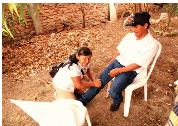
Figura 4. Percibiendo la “seña”

Durante el “cateo”, el sobandero/a recorre mediante la palpación el área que concentra el interés del consultante. Dicha palpación involucra maniobras pasivas – posar la palma de las manos sobre el área afectada, buscando anomalías de forma -, y maniobras activas – ejercicios de presión buscando zonas dolorosas o la sensorcepción de la “seña”-. Las diferentes articulaciones son objeto de particular interés, las cuales se consideran puntos de quiebre, frágiles y delicados, que permiten que agentes como el “frío” penetren en el cuerpo y produzcan la desarmonización correspondiente.