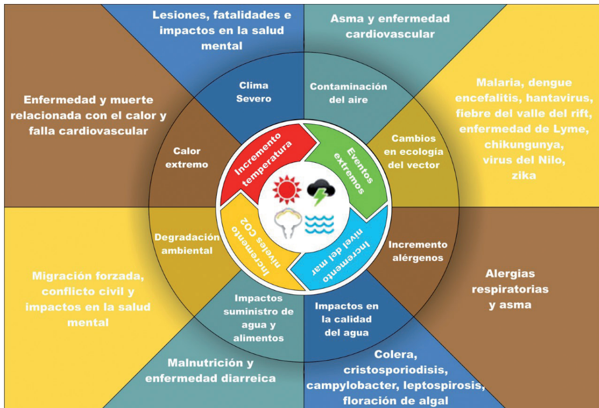
Figura 1. Impactos del cambio climático en salud

El cuarto mecanismo se puede presentar al afectar las cosechas, la producción pecuaria y piscícola, con efectos en el acceso de alimentos, la nutrición y la salud. Finalmente el quinto mecanismo se presenta como efectos de la pérdida de enseres, bienes y en algunos casos desplazamiento como resultado de eventos climáticos extremos, como inundaciones, sequías, derrumbes, que aumentan la pobreza, afecta la salud mental, incrementa la posibilidad de enfermedades infecciosas, la malnutrición y la exposición a riesgos físicos, ( Figura 1 ).