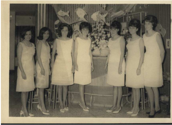
Figura 3. Primera promoción de egresadas Universidad Femenina de Santander. 1966

principales cambios se derivó del cumplimiento de los lineamientos establecidos por la Ley 9° de 1976 que, como ya se mencionó, transformó el nivel académico técnico en profesional universitario.