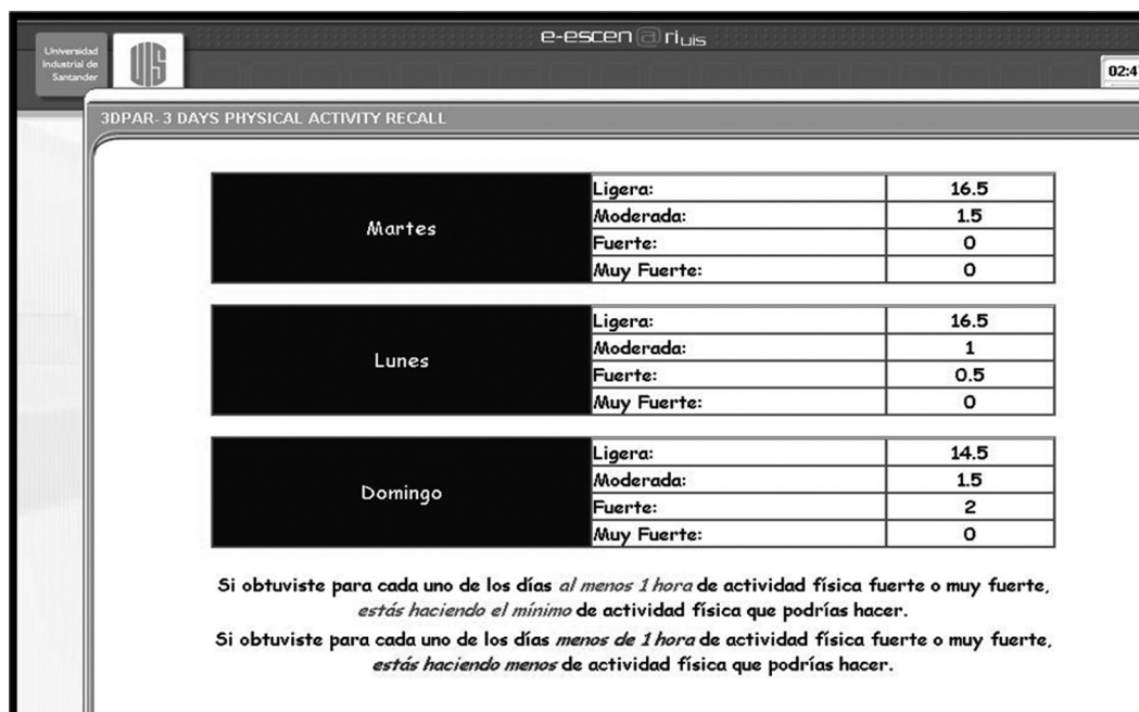
Figura 1b. Hoja de resultados por día y nivel de intensidad de actividad física realizada en el formato digital 3DPAR.

información. Después de diligenciar los tres días, iniciando por el martes, luego el lunes y finalmente el domingo, se generó una nueva pantalla con el resultado en horas de AF por cada día de la semana evaluado ( Figura 1b ) y una recomendación general para la práctica de la AF.