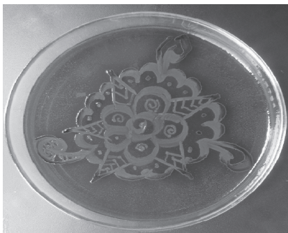
Título: Salmonella spp's Mandala Elaborada por: Silvia Figueroa