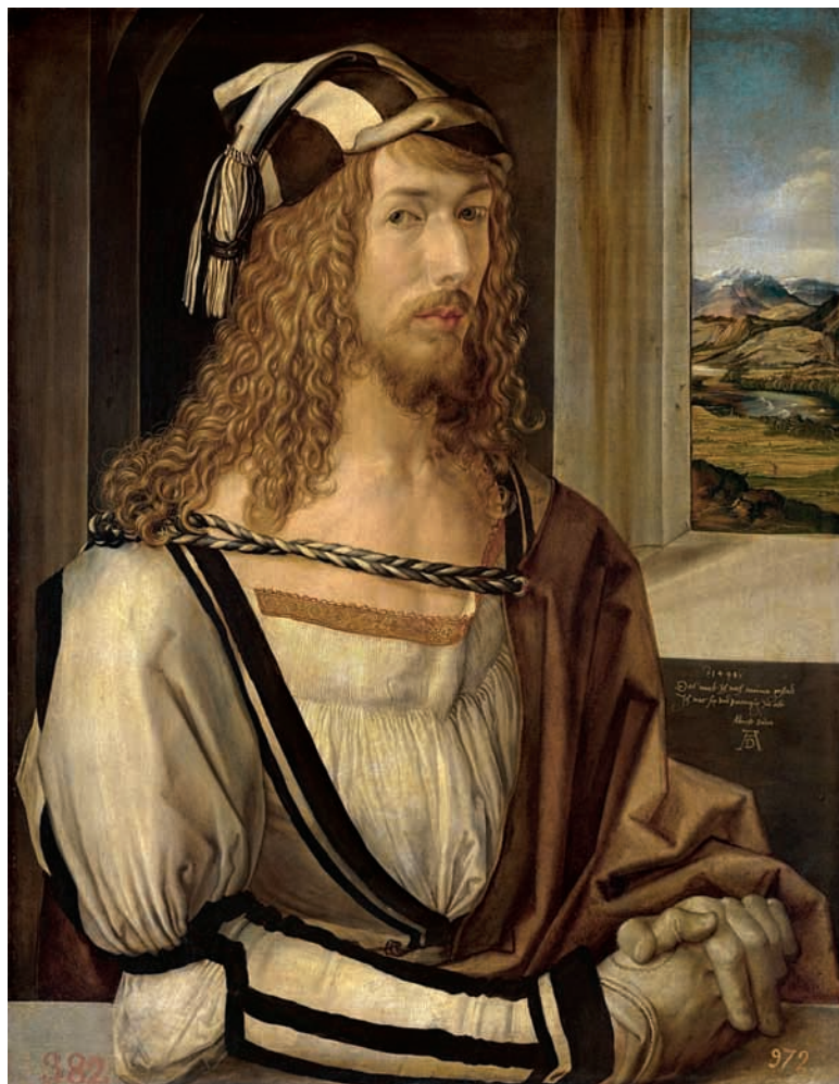
Autorretrato de Alberto Durero.

El que miente y se excusa declarando: todo el mundo no procede así, es alguien que no está bien con su conciencia, porque el hecho de mentir implica un valor universal atribuido a la mentira. Incluso cuando la angustia se enmascara, aparece. Es esta angustia la que Kierkegaard llamaba la angustia de Abraham. Conocen ustedes la historia: un ángel ha ordenado a Abraham sacrificar a su hijo; todo anda bien si es verdaderamente un ángel el que ha venido y le ha dicho: tú eres Abraham, sacrificarás a tu hijo. Pero cada cual puede preguntarse; ante todo, ¿es en verdad un ángel, y yo soy en verdad Abraham? ¿Quién me lo prueba? Había una loca que tenía alucinaciones: le hablaban por teléfono y le daban órdenes. El médico le preguntó: Pero ¿quién es el que habla? Ella contestó: Dice que es Dios. ¿Y qué es lo que le probaba, en efecto, que fuera Dios? Si un ángel viene a mí, ¿qué me prueba que es un ángel? Y si oigo voces, ¿qué me prueba que vienen del cielo y no del infierno, o del subconsciente, o de un estado patológico? ¿Quién prueba que se dirigen a mí? ¿Quién me prueba que soy yo el realmente señalado para imponer mi concepción del hombre y mi elección a la humanidad? No encontraré