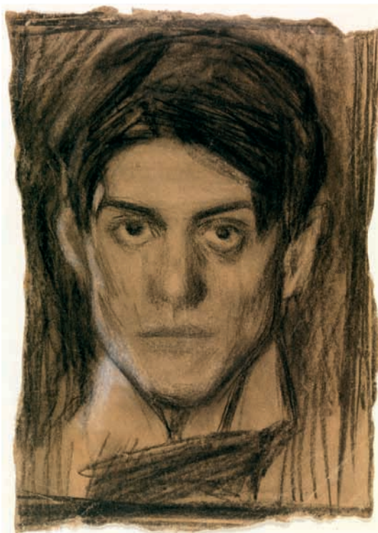
Autorretrato de Pablo Picasso.

ferencia entre ser un absoluto temporalmente localizado, es decir que se ha localizado en la historia, y ser comprensible universalmente.