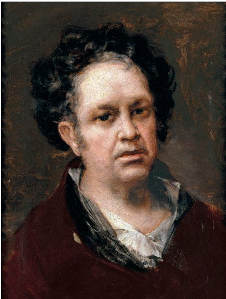
Autorretrato de Francisco de Goya.

suprimir a Dios con el menor gasto posible. Cuando hacia 1880 algunos profesores franceses trataron de constituir una moral laica, dijeron más o menos esto: Dios es una hipótesis inútil y costosa, nosotros la suprimimos; pero es necesario, sin embargo, para que haya una moral, una sociedad, un mundo vigilado, que ciertos valores se tomen en serio y se consideren como existentes a priori; es necesario que sea obligatorio a priori que sea uno honrado, que no mienta, que no pegue a su mujer, que tenga hijos, etc., etc. Haremos, por lo tanto, un pequeño trabajo que permitirá demostrar que estos valores existen, a pesar de todo, inscritos en un cielo inteligible, aunque, por otra parte, Dios no exista. Dicho en otra forma y es, según creo yo, la tendencia de todo lo que se llama en Francia radicalismo, nada se cambiará aunque Dios no exista; encontraremos las mismas normas de honradez, de progreso, de humanismo, y habremos hecho de Dios una hipótesis superada que morirá tranquilamente y por sí misma. El existencialista, por el contrario, piensa que es muy incómodo que Dios no exista, porque con él desaparece toda posibilidad de encontrar valores en un cielo inteligible; ya no se puede tener el bien a priori, porque no hay más conciencia infinita y perfecta para pensarlo; no está escrito en ninguna parte que el bien exista, que haya que ser honrado, que no haya que mentir; puesto que precisamente estamos en un plano donde solamente hay hombres.