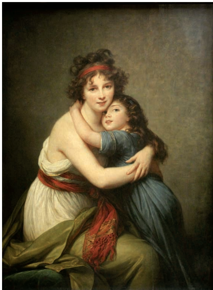
Autorretrato de Marie Louise Lebrun, con su hija Julie.

se está perfectamente tranquilo, no hay nada que hacer, se será cobarde toda la vida, hágase lo que se haga; si se nace héroe, también se estará perfectamente tranquilo, se será héroe toda la vida, se beberá como héroe, se comerá como héroe. Lo que dice el existencialista es que el cobarde se hace cobarde, el héroe se hace héroe; hay siempre para el cobarde una posibilidad de no ser más cobarde y para el héroe de dejar de ser héroe. Lo que tiene importancia es el compromiso total, y no es un caso particular, una acción particular lo que compromete totalmente.