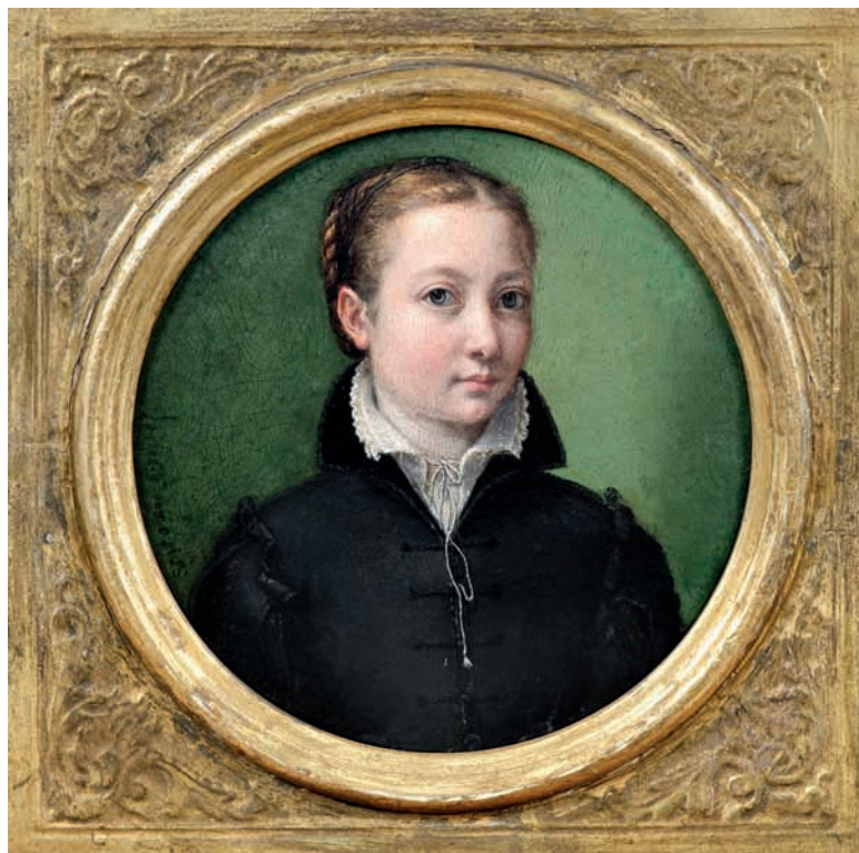
Sofonisba Anguissola (1535-1625), autorretrato. Considerada la primera mujer pintora de éxito del Renacimiento italiano.

Al concebir un Dios creador, este Dios se asimila la mayoría de las veces a un artesano superior; y cualquiera que sea la doctrina que consideremos, trátese de una doctrina como la de Descartes o como la de Leibniz, admitimos siempre que la voluntad sigue más o menos al entendimiento, o por lo menos lo acompaña, y que Dios, cuando crea, sabe con precisión lo que crea. Así el concepto de hombre, en el espíritu de Dios, es asimilable al concepto de cortapapel en el espíritu del industrial; y Dios produce al hombre siguiendo técnicas y una concepción, exactamente como el artesano fabrica un cortapapel siguiendo una definición y una técnica. Así, el hombre individual realiza cierto concepto que está en el entendimiento divino. En el siglo XVIII, en el ateísmo de los filósofos, la noción de Dios es suprimida, pero no pasa lo mismo con la idea de que la esencia precede a la existencia. Esta idea la encontramos un poco en todas partes: la encontramos en Diderot, en Voltaire y aun en Kant. El hombre es poseedor de una naturaleza humana; esta naturaleza humana, que es el concepto humano, se encuentra en todos los hombres, lo que significa que cada hombre es un ejemplo particular de un concepto universal, el hombre; en Kant resulta de esta