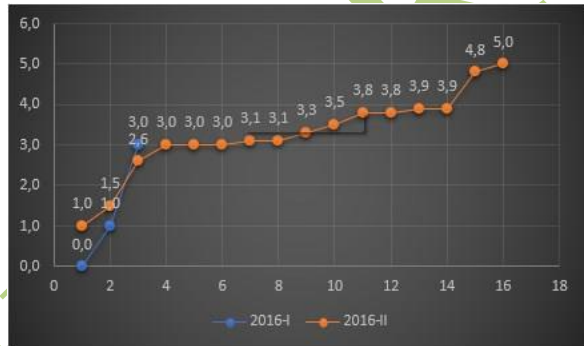
Figura 4. Comparativo Notas Finales Cálculo Diferencial Programa de Ingeniería Biomédica - Año 2016