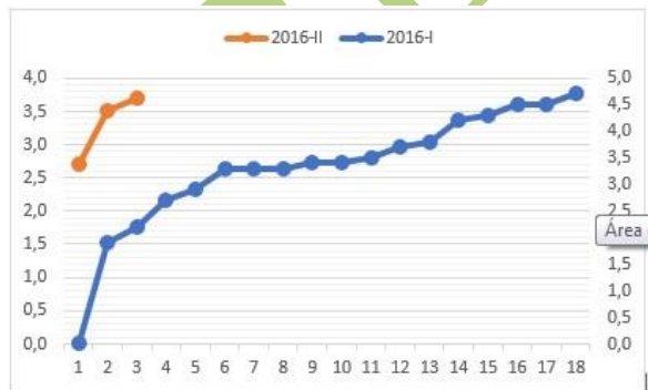
Figura 3. Comparativo Notas Álgebra Lineal Programa de Ingeniería Biomédica - Año 2016