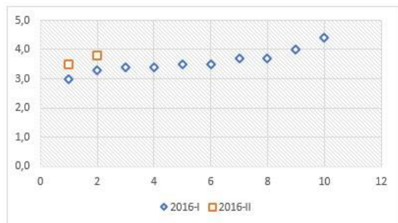
Figura 5. Notas Finales Cálculo Integral Programa de Ingeniería Biomédica - Año 2016