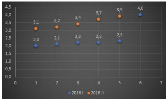
Figura 8. Comparativo Notas Finales Cálculo Diferencial Programa de Ingeniería Industrial - Año 2016