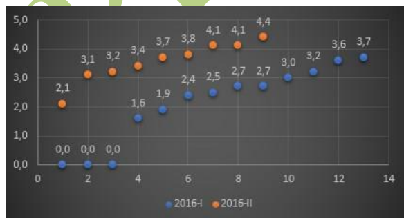
Figura 6. Comparativo Notas Finales Matemáticas Básicas Programa de Ingeniería Industrial - Año 2016