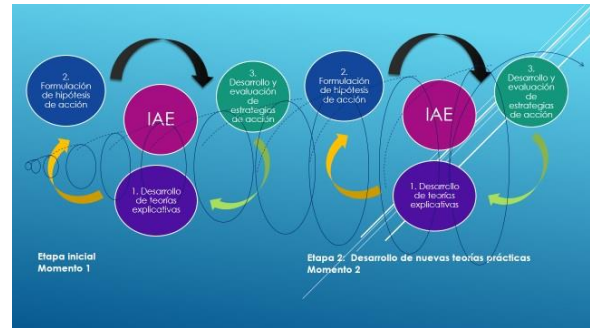
Figura 1. Espiral investigativa-Referente Elliott, 2010.

3. Desarrollo y evaluación: “Es una forma de comprobación de hipótesis. El resultado puede indicar la necesidad de aclarar más el problema y de la posterior modificación y desarrollo de las hipótesis de acción” (Elliott, 2010, p.98). En esta etapa se surten dos subprocesos, el primero es el desarrollo de las estrategias de solución que se generaron en la etapa anterior, y el segundo es el proceso de evaluación que será el punto de partida para las siguientes etapas donde se realizará de nueva cuenta el proceso en espiral desde la construcción de un bucle sistémico donde cada ciclo desarrollado potencia al siguiente con alternativas de mejora. El proceso sistémico se presenta en el siguiente esquema: